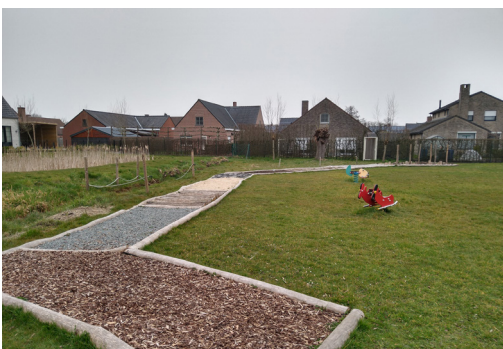
Het blotevoetenpad ligt er verlaten bij

Daarnaast is ook het algemeen gebruik van publieke ruimte soms “too little too late”. Ruiselede kent heel wat open plekken waarvan wij liever groene aantrekkelijke ontmoetingsplaatsen willen maken voor buurtbewoners en passanten. Zo is er het speelplein in Kruiskerke of de groenzone tussen de Weefschoolstraat en de Knotwilgenstraat in het centrum. Beide locaties vormen ideale plaatsen voor moderne, toegankelijke en gezellige ontmoetingsplaatsen voor de buurtbewoners, zowel jong als oud. Op beide locaties deed de gemeente de afgelopen jaren ook investeringen, maar de algemene visie ontbreekt volgens ons compleet. In het centrum werd een blotevoetenpad aangelegd, in afwachting van een effectief speeltuintje. Wat is de toegevoegde waarde van dit blotevoetenpad? Waarom is zo'n investering nodig als toch geweten is dat er een