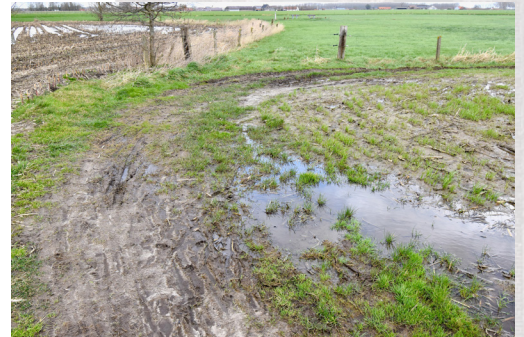
Huidige toestand van de trage weg naar Kruiskerke...

Ten eerste is fietsminnend Ruiselede het eens over het gevaar van de Wantestraat. Vrachtwagens, hoge snelheden, voorrangskruispunten: fietsen van Kruiskerke naar Ruiselede is niet altijd een pretje. Nochtans is er een fietsverbinding die perfect door natuur en rustige wegen te realiseren valt. Een fietser waagt er zich vandaag echter niet aan, op gevaar van eigen leven. De trage fietsverbinding vanuit de Veldstraat ligt er vuil, niet onderhouden en rondt ontogankelijk bij. Hoogstens een voetganger met het juiste schoeisel kan hier gebruik van maken. Nochtans is deze parallelweg dé ideale fietsverbinding met Kruiskerke. Een goed, gestructureerd onderhoud die fietsen mogelijk maakt, in afwachting van latere plannen met de trage wegen: volgens ons kan er (veel) meer dan hetgeen vandaag te gebeuren staat.